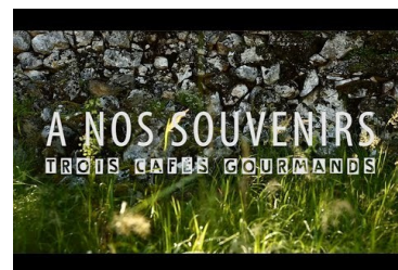
Trois cafés gourmands 2017